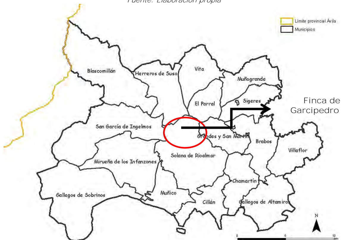
Figura 1: Municipios del ámbito de actuación

La población del territorio, de algo más de 1600 habitantes, ocupa una extensión de 379 km 2 . El territorio representa una unidad geográfica que fortalece la identidad y la cohesión territorial, así como una alta diversidad de recursos de distinta índole: productivos (agricultura y ganadería), culturales y ambientales que facilitan la creación de sinergias entre los actores locales. En la siguiente tabla se detallan las actividades realizadas desde la creación de la Cátedra, tanto en el marco de un acuerdo inicial para el lanzamiento del Programa como en el marco del Convenio Fundación Tatiana Pérez de Guzmán el Bueno - UPM.