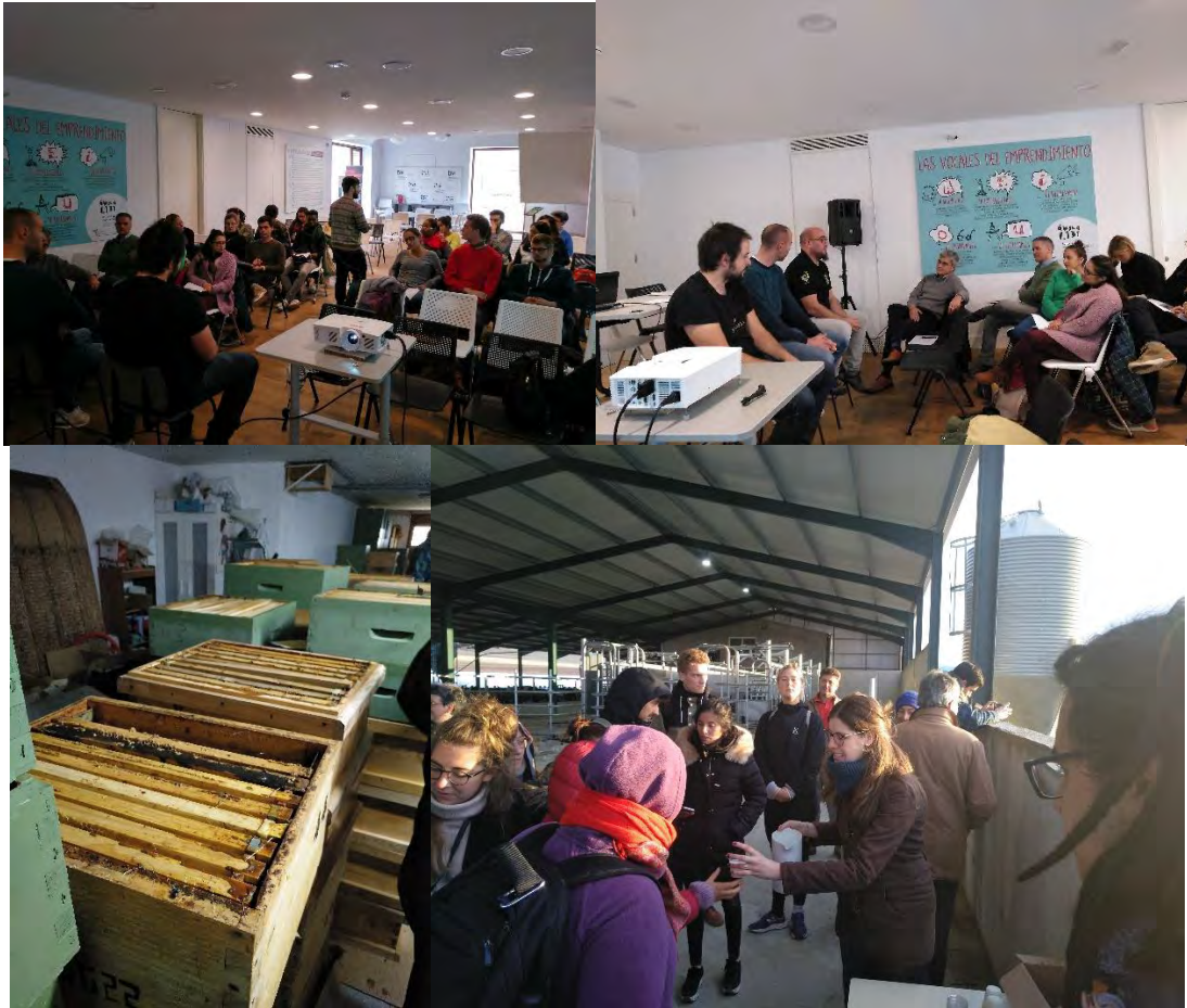
Distintos momentos de la visita. En las fotos superiores en el Observatorio 1.131 con emprendedores del Programa "Emprende 1.131". En las fotos inferiores: Izquierda, visita al proyecto "Miel Candelas". Derecha: Visita al proyecto "Los Coyotes".